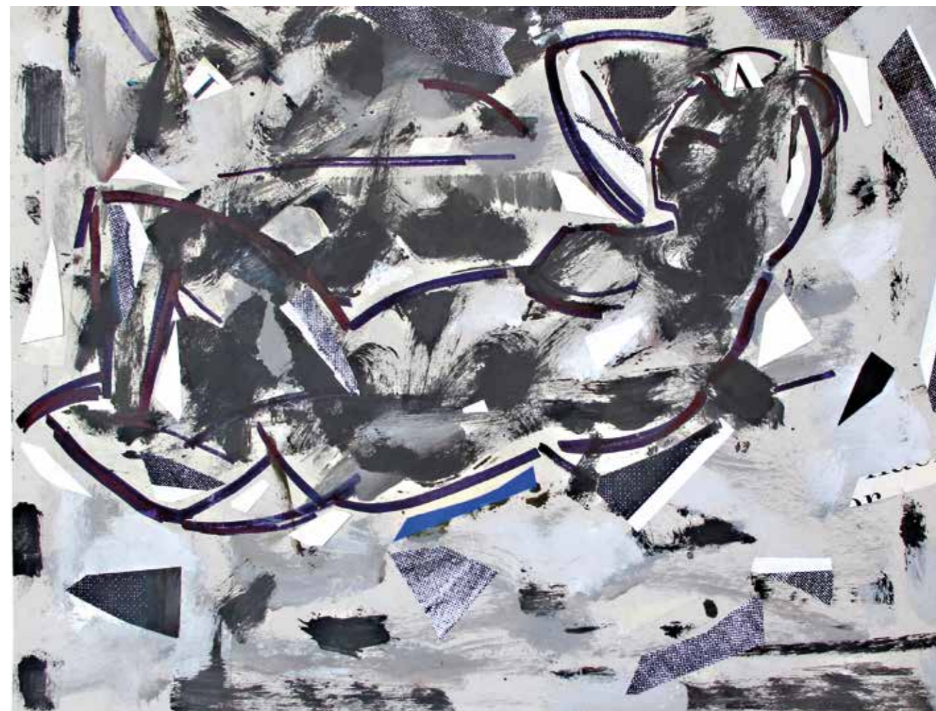
Tombada. Pintura collage, 50x70 cm