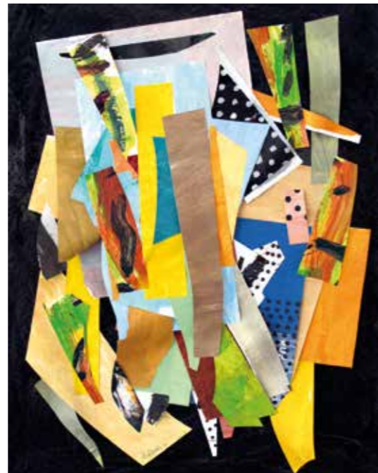
S/T. Pintura serigrafia collage