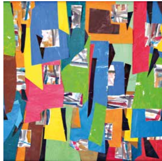
S/T. Pintura serigrafia collage, 75x75 cm