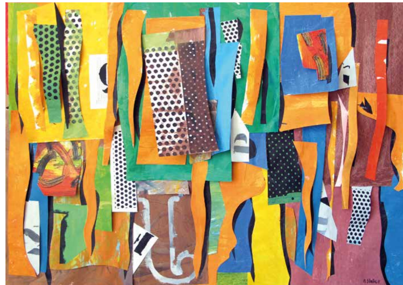
S/T. Pintura serigrafía collage, 75x105 cm