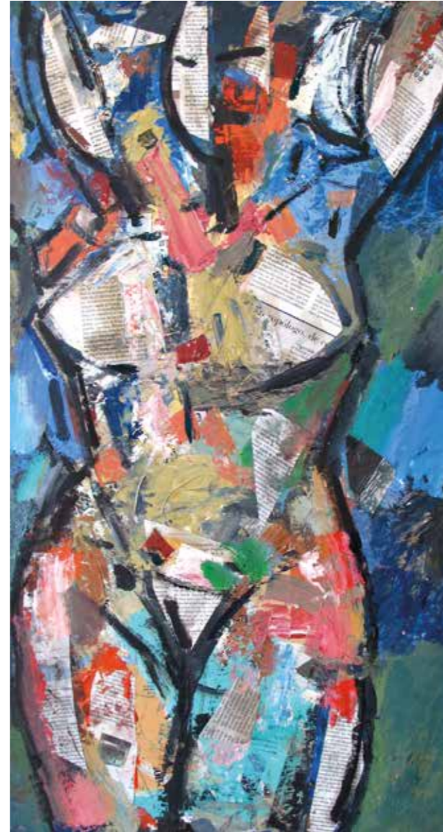
Figura. Pintura collage, 75x35 cm