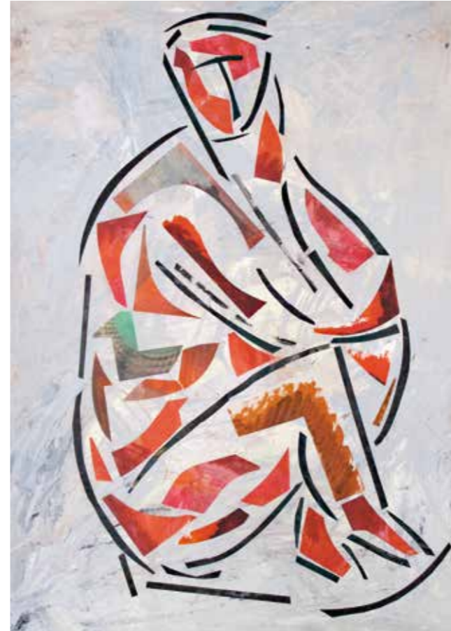
Incertesa. Pintura collage, 105x75 cm