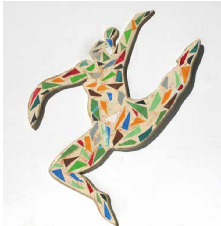
Contorsionista . Figura relieve collage, 28x38 cm