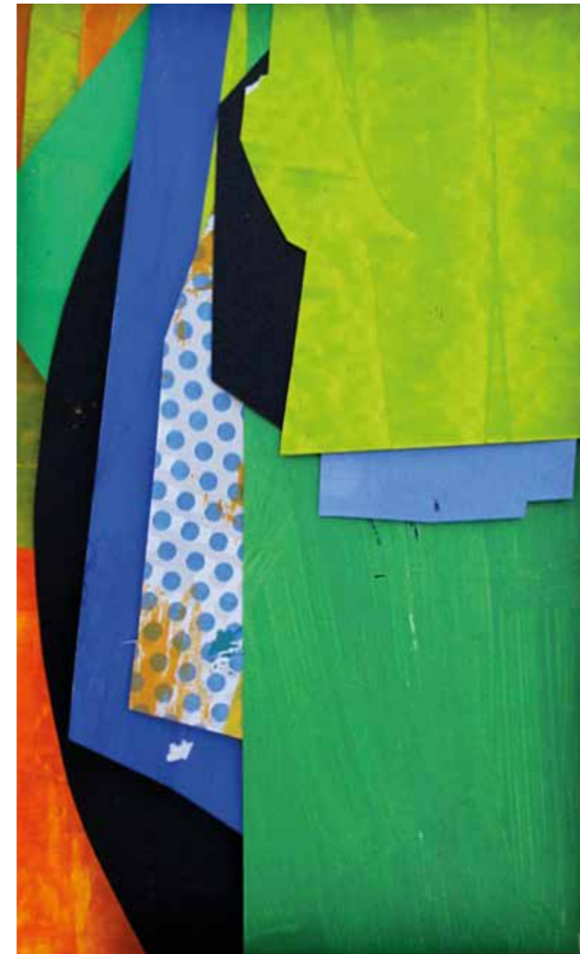
S/T. Pintura serigrafia collage, 40x28 cm