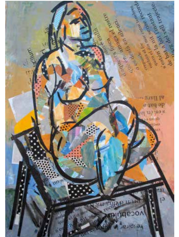
Recolzada. Pintura collage, 105x75 cm