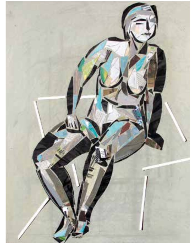
Asseguda . Pintura collage, 75x59 cm