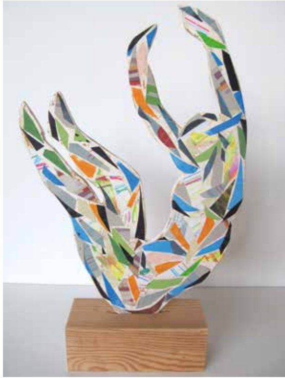
Contorsionista . Figura relieve collage, 33x22 cm