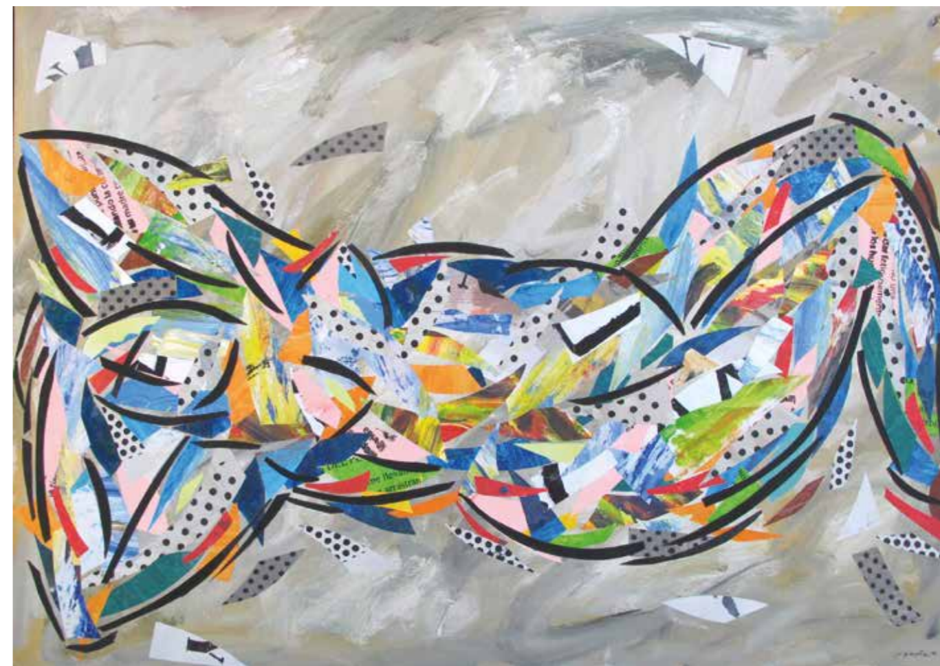
Gitada . Pintura collage, 75x105 cm