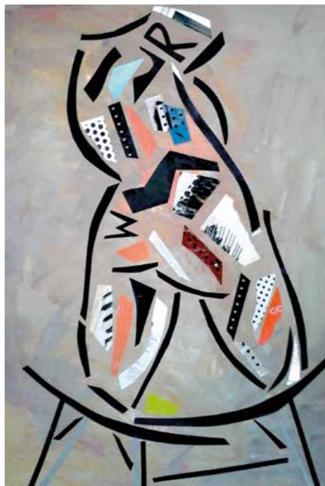
Torso. Pintura collage, 75x52 cm