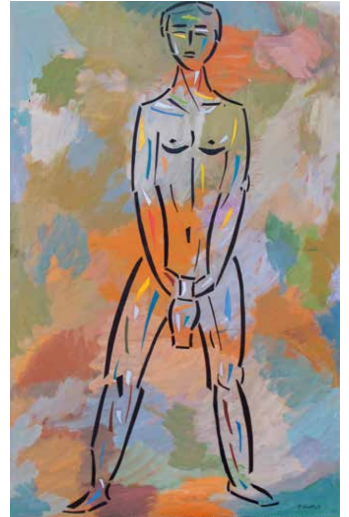
La llarga. Pintura collage, 122x75 cm