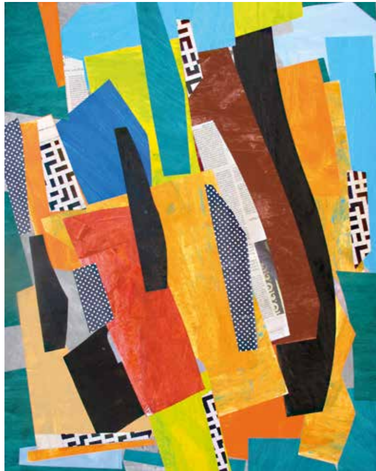
S/T. Pintura serigrafia collage, 100x82 cm