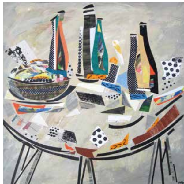
Bodegó. Pintura collage, 75x75 cm