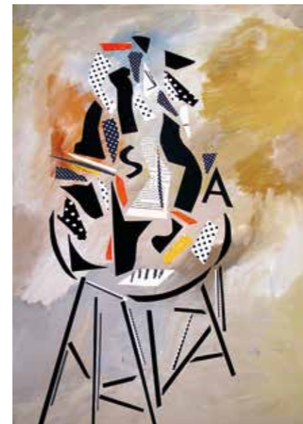
Escultura. Pintura collage, 75x55 cm