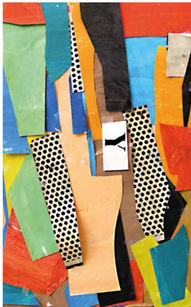
Y. Pintura serigrafía collage, 66x41 cm