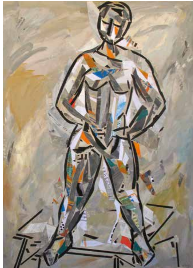
Banyista. Pintura collage, 75x105 cm