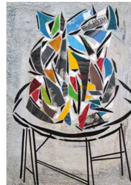
Escultura en procés. Pintura collage, 75x55 cm