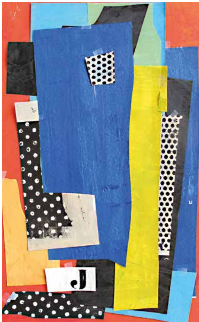
J. Pintura serigrafía collage, 66x41 cm