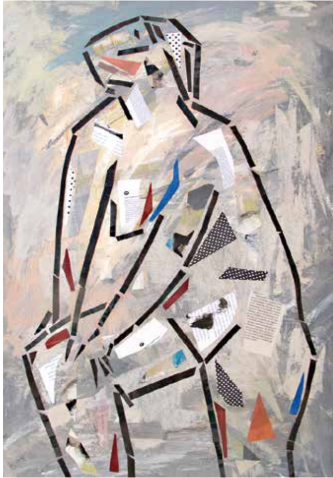
Figura. Pintura collage, 75x53 cm