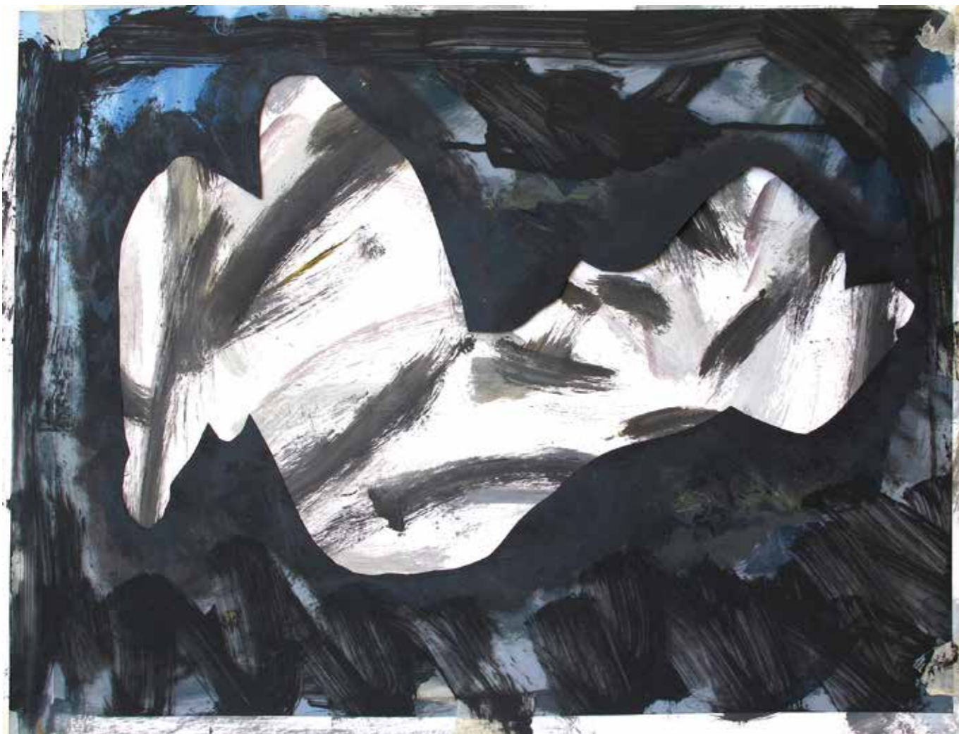
Gitada . Dibuix, 50x72 cm