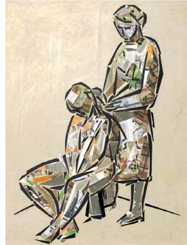
Xiquetes pentinant-se . Pintura collage, 75x59 cm