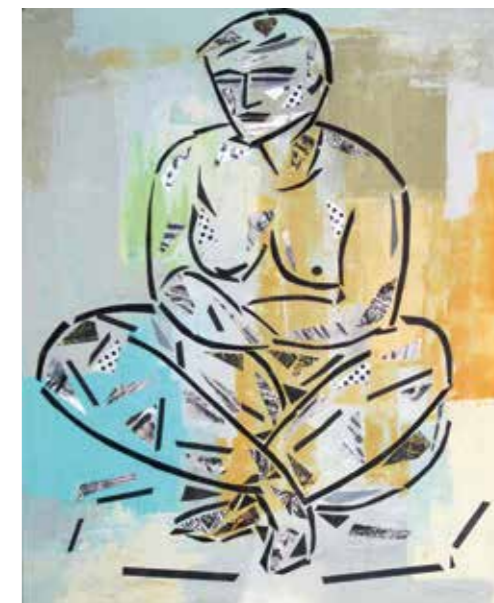
Model. Pintura collage, 64x49 cm