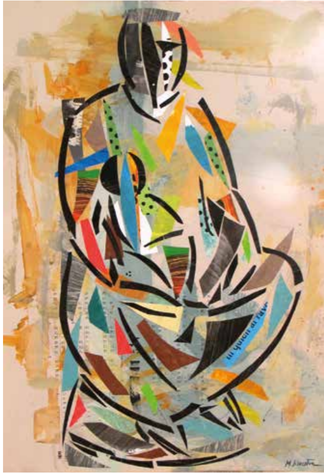
Bressol. Pintura collage, 85x42,5 cm