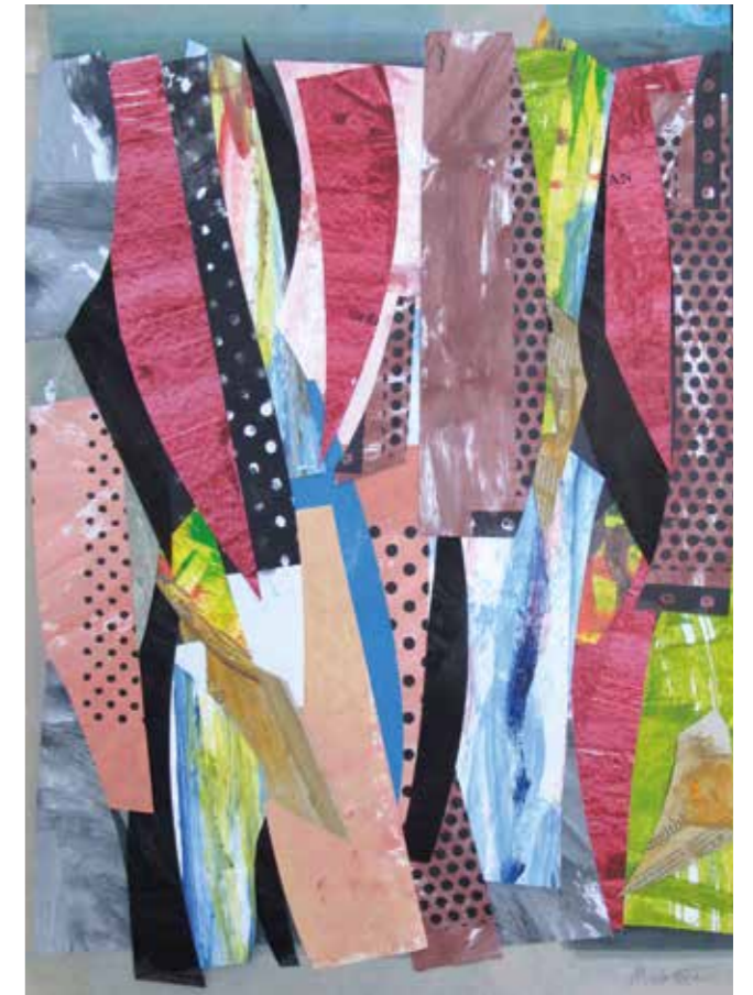
Banyista. Pintura collage, 70x50 cm