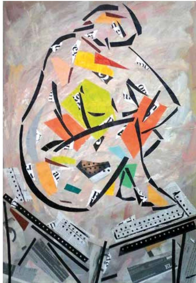
Reflexió. Pintura collage, 75x53 cm