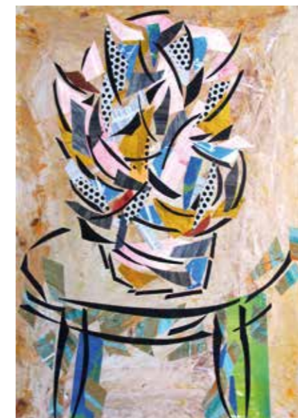
Flors. Pintura collage, 75x52,5 cm