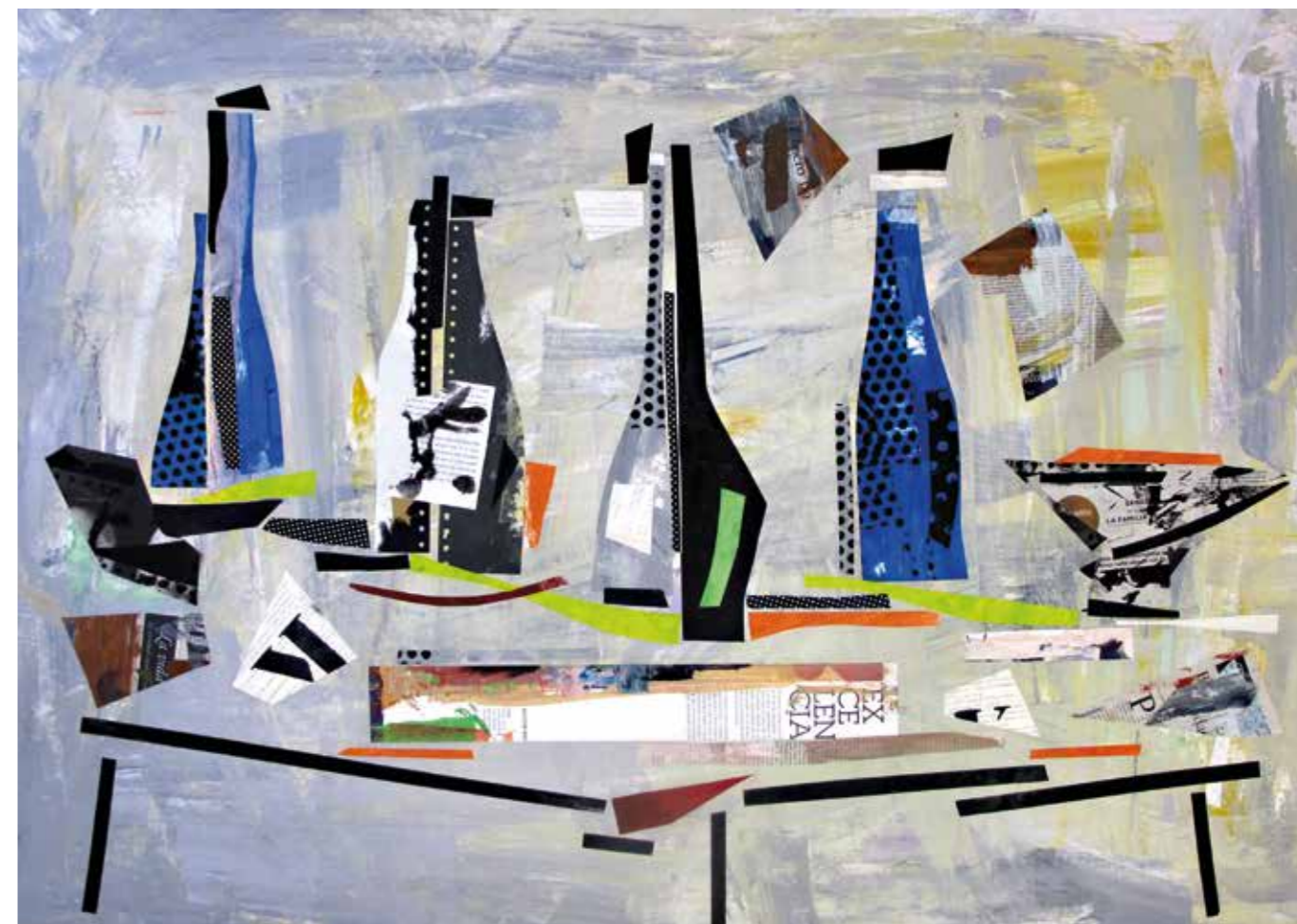
Bodegó. Pintura collage, 75x105 cm