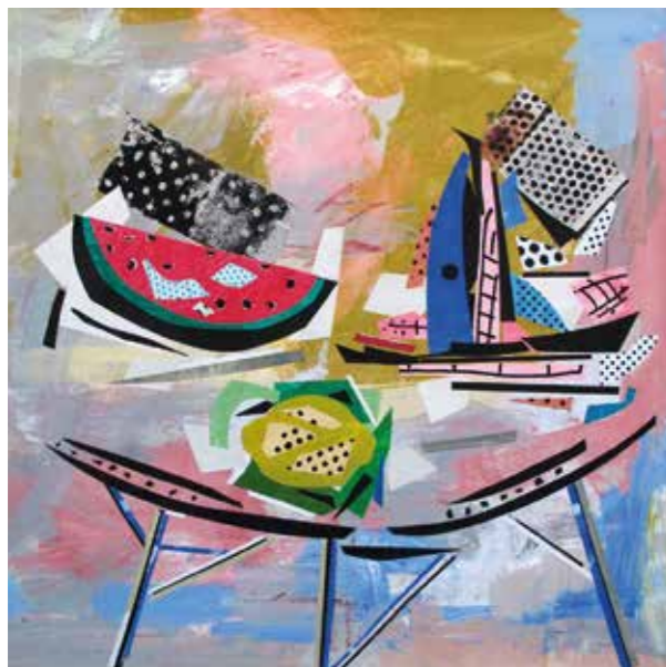
Bodegó. Pintura collage, 80x80 cm