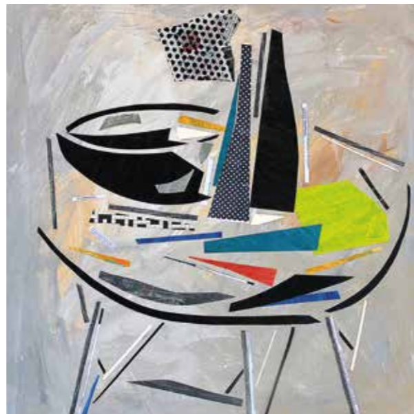
Bodegó. Pintura collage, 80x80 cm