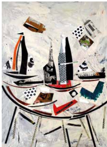
Bodegó. Pintura collage, 105x75 cm