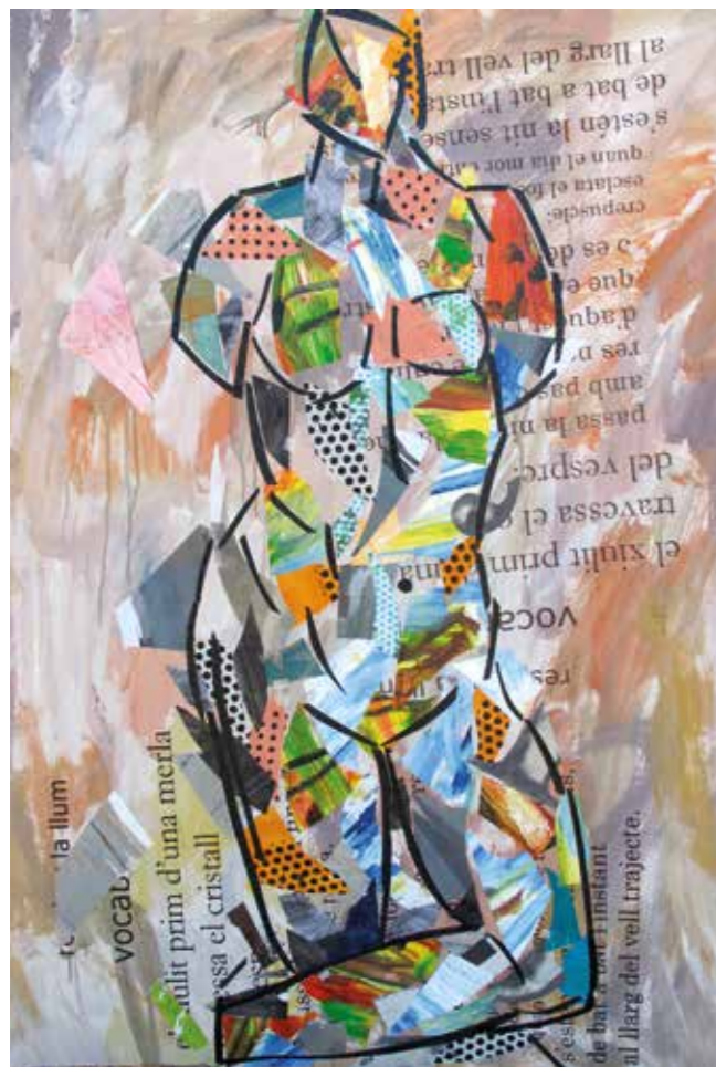
Torso. Pintura collage, 105x75 cm